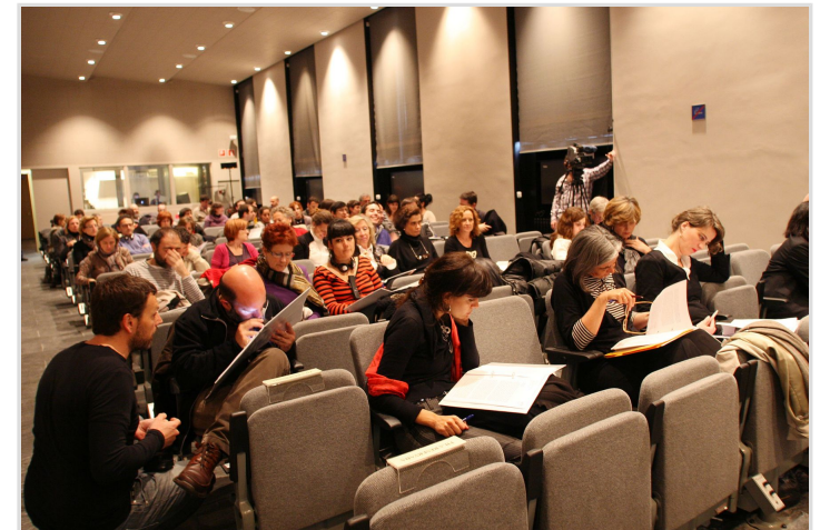
Asistentes al simposio