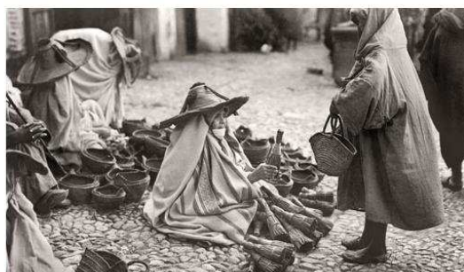
Zoco del trigo, Tetuán, 1928. Bartolomé Ros